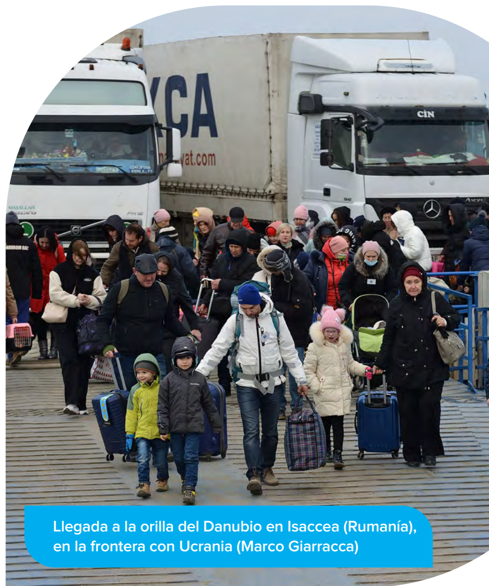
Llegada a la orilla del Danubio en Isaccea (Rumanía), en la frontera con Ucrania (Marco Giarracca)

Mientras el conflicto continúa, con consecuencias catastróficas para la población, el JRS y los jesuitas siguen estando presentes y movilizando recursos para apoyar a los más afectados. Junto con la Red Xavier, estamos coordinando la puesta en marcha de la One Proposal, un plan estructurado para acoger, proteger, promover e integrar a los ucranianos que han sido desplazados por la fuerza en toda Europa.