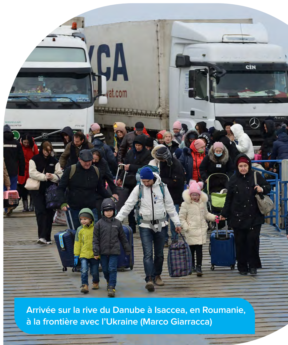
Arrivée sur la rive du Danube à Isaccea, en Roumanie, à la frontière avec l'Ukraine (Marco Giarracca)

Alors que le conflit se poursuit, avec des conséquences dévastatrices pour la population, le JRS et les Jésuites continuent à être présents et à mobiliser des ressources pour soutenir les personnes les plus touchées. Avec le Réseau Xavier, nous coordonnons la mise en œuvre de la proposition unique, un plan structuré pour accueillir, protéger, promouvoir et intégrer les Ukrainiens déplacés de force à travers l'Europe.